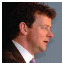
Tony Hayward , PDG, Exploration et Production, BP plc, Londres (Royaume-Uni)